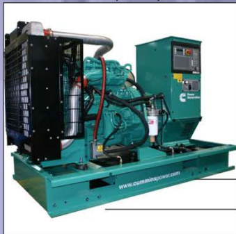
Дизельная Генераторная Установка